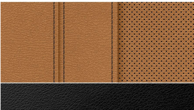
Оббивка зі штучної шкіри "Sensatec" з КНКС 42 228,00 €