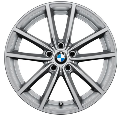
17" диски V-spoke style 778 1S3